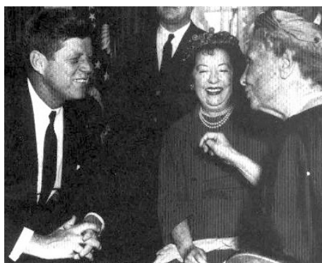
Helen Keller et le Président J.F.Kennedy

Ceci donnera aux acteurs, d'une part, la liberté de faire vivre des métaphores poétiques d'une grande précision et, d'autre part, donnera aux spectateurs la liberté de compléter ce tableau vivant de leurs propres sensations, faisant d'eux les acteurs vivants d'une histoire qui s'écrit encore.