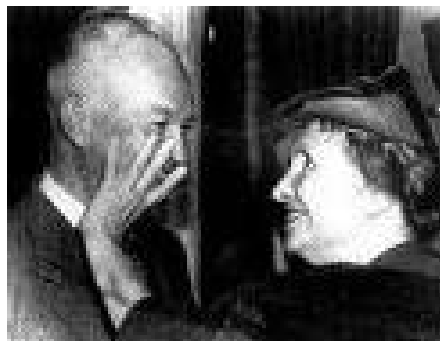
Helen Keller et le Président Eisenhower